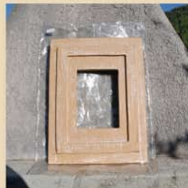
Le blanc deviendra transparent en séchant