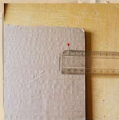
Les poser selon le schéma suivant