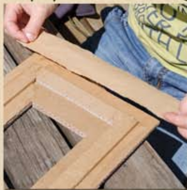
Les poser avec soin