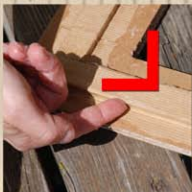
Faire ressortir l'angle