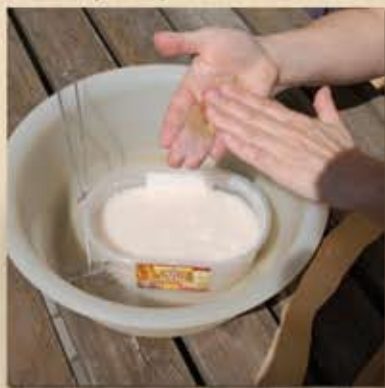
Bien enduire les morceaux de papier