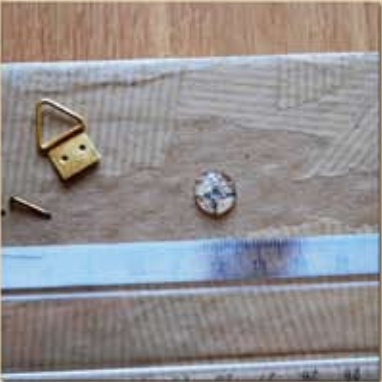
Y mettre un gros point de colle