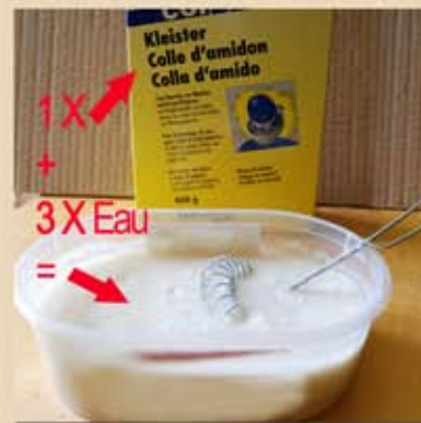
Préparer la colle