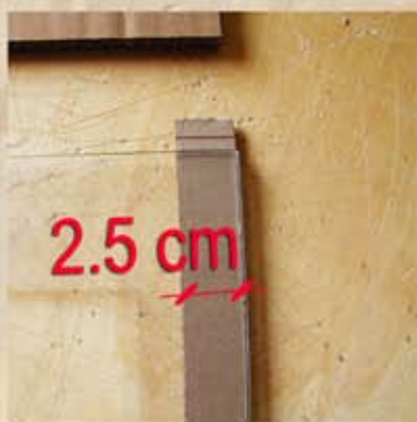
Couper des bandes de 2.5cm de larges