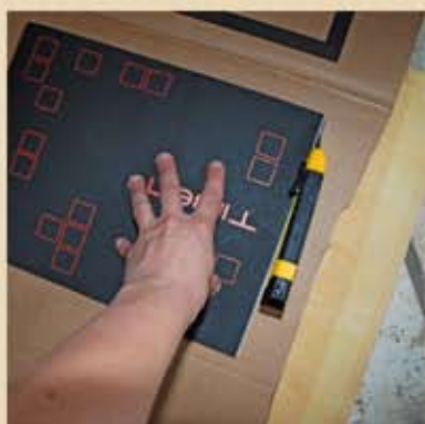
Appuyer fortement et découper le tour