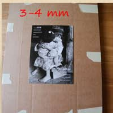
Poser l'image, dessiner le tour et couper en veillant à laisser 3 à 4 mm pour coller la photo