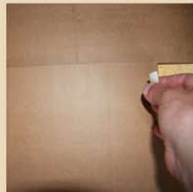
Scotcher le 1er rectangle sur le carton et recommencer