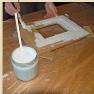
Un vieux pinceau fera l'affaire