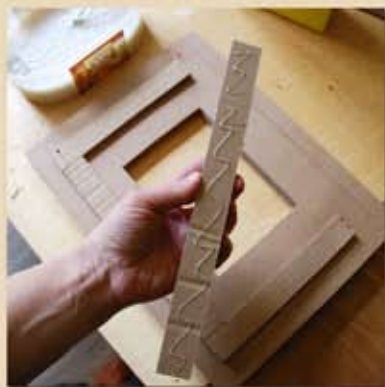
Tenir les bandes avec des épingles. Coller...