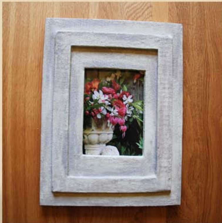
Pas besoin de gros clou c'est léger une punaise suffira