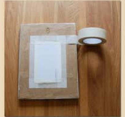
Centrer l'image et la coller avec du scotch