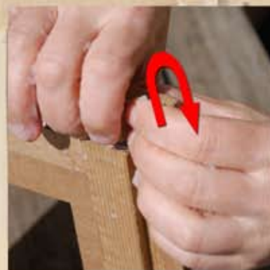
Croiser la 2ème bande