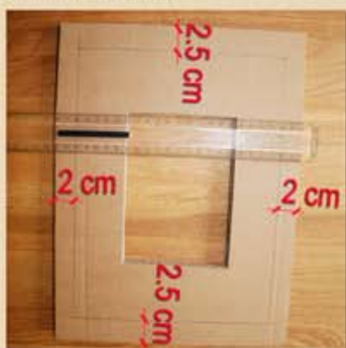
2.5 cm haut + bas 2 cm de chaque côté