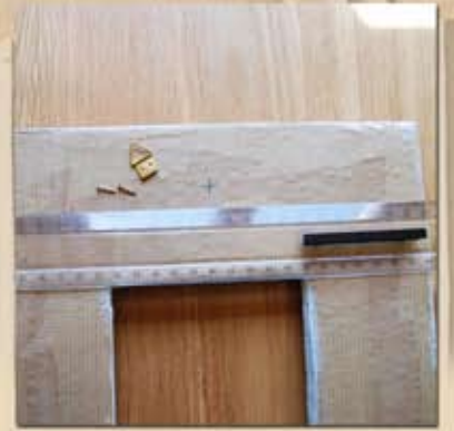
Marquer le milieu du cadre au crayon