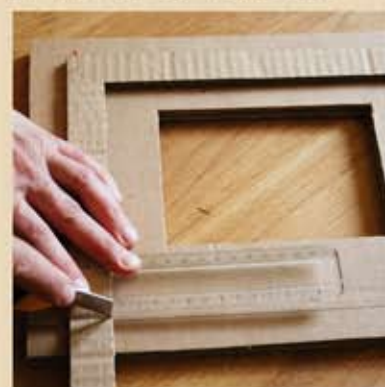
Veiller à faire un angle bien droit