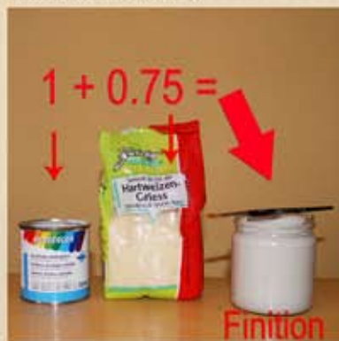
Mixture de finition