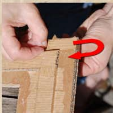
Poser la 1ère bande