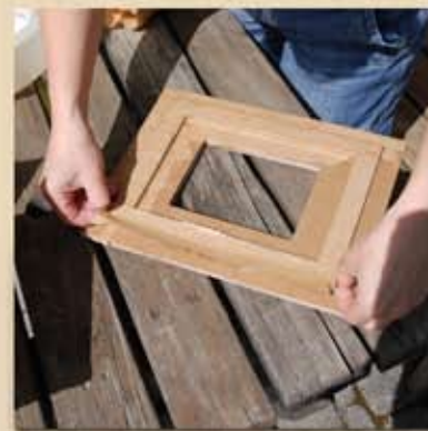
Vérifier les longueurs