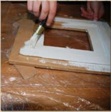
Remplir chaque trou