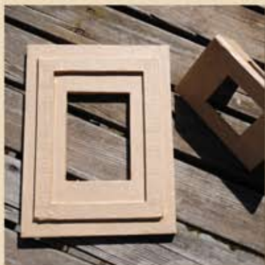
Le cadre est sec