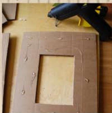
Coller les deux plaques ensembles