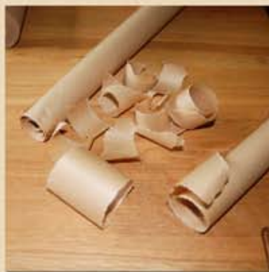
Déchirer des morceaux de papier d'emballage