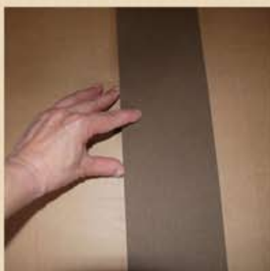
Prendre une règle et finir la découpe en profondeur