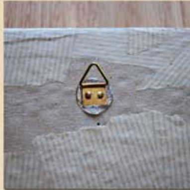
Y placer l'oeillet Attention c'est chaud !