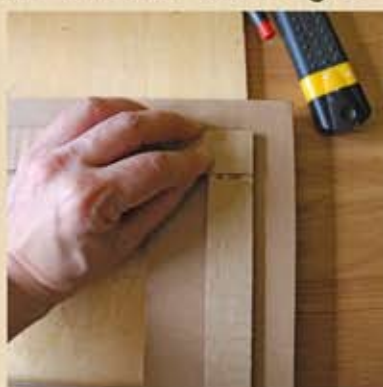
Bien jointoyer les bordures